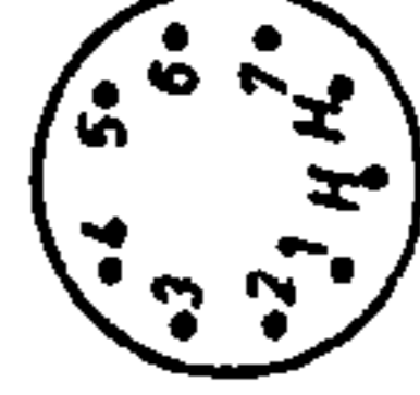
UCH81, UA, BC60, UF85